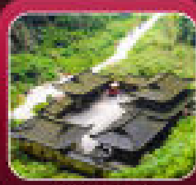
*อุทยานเทานางฟ้า*