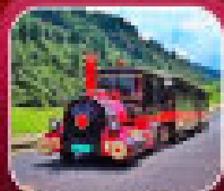
*อุทยานเทานางฟ้า*