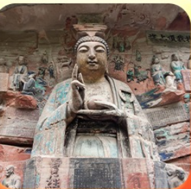
“ผาหินแกะสลักต้าจู้”