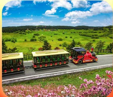
“อุทยานเขานางฟ้า”

บินตรงลงเชียงใหม่ • อุโมงค์ หลุมฟ้าสะพานสวรรค์ • ระเบียบแก้ว • อุทยานเขานางฟ้า หงหยาดัง • นั่งรถไฟทะเลสาบ • ล่องเรือชมดวงจันทร์ยามค่ำคืน • ศาลาประชาคม (ด้านนอก) มรดกโลกผาหินแกะสลักต้าจู้ • เมืองโบราณสีปาที้ • วัดหลิวฮั่น • ตึกตะเกียบ