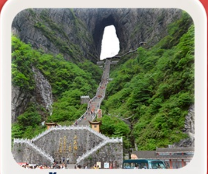
"กำประตูลงสวรรค์"