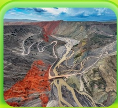
"แกรนด์แคนยอนคู่ชานโจ้ว"

ซินเจียงเหนือ ทะเลสาบไซลีมู่ "น้ำตาหยดสุดท้ายของแอตแลนติก" • กุ้งหน้านาราตี กุ้งดอกไม้เทียนซาน • ผ่านชมสะพานกั๋วจื่อโกว • ถนนหลิวซิงเจียง • ตลาดต้าปาจา