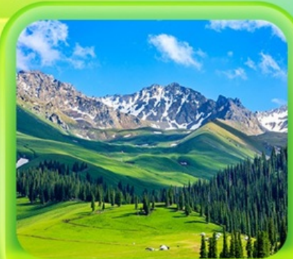
"กุ้งหน้านาราตี"