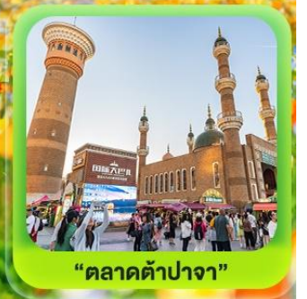
“ตลาดต้าปาจา”

ซินเจียงเหนือ ทะเลสาบไซลีมู่ "น้ำตาหยดสุดท้ายของแอตแลนติก" • กุ่มหญ้านาราที กุ่มดอกไม้เทียนซาน • ผ่านชมสะพานกั๋วจื่อโกว • ถนนหลิวซิงเจียง • ตลาดต้าปาจา