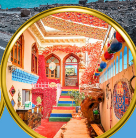
เมืองเก๋าคัชการ์