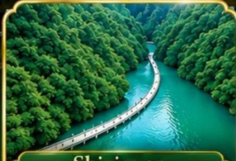
Shiziguan ด่านสิงโต ซือจื่อกวน