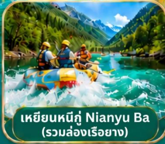
เหยียนหนีกู่ Nianyu Ba (รวมล่องเรือ)