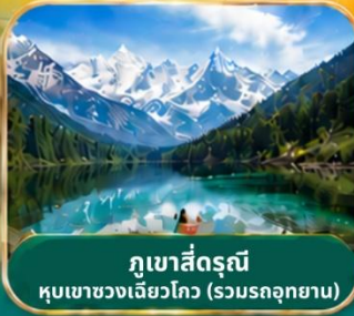
กูเขาสีดรุณี หุบเขาของเจียวโกว (รวมรถอุทยาน)