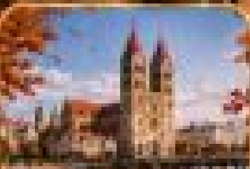
เมืองมรดกโลกชิงเต่า