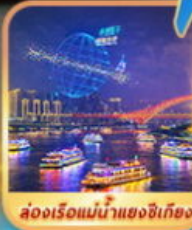
ล่องเรือแม่น้ำแยงซีเกียง