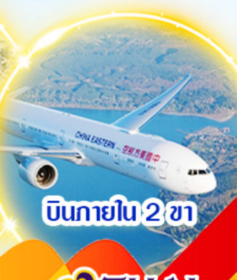
บินภายใน 2 ชม