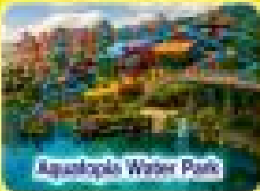
Aquaplus Water Park