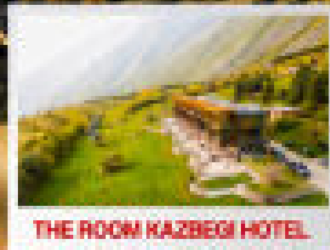
THE ROOM KAZBEGI HOTEL