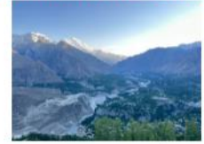
หุบเขาเคอร์เกอร์

*พักที่ Duike : Hard Rock Resort หรือเทียบเท่า