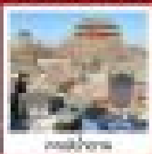
กำแพงเมือง