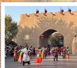
เมืองโบราณคัชการ์