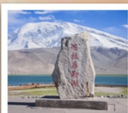
ทะเลสาบกาลากูเล่อ