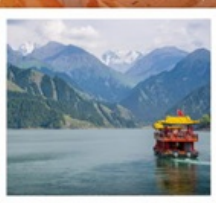
ช่องเรือทะเลสาบเทียนฉือ

เส้นทางสายไหม เริ่มต้นเพียง 53,999 FREE VISA