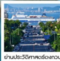
ย่านประวัติศาสตร์ตงกวน

Fisherman's Wharf • จัตุรัสซิงไห่ (รวมรถราง) • ถนนตงกวน • เวนิสแห่งต้าเหลียน • ถนนรัสเซีย