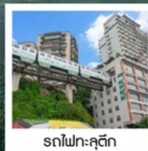
รถไฟฟ้าทุติย

มหาศาลาประชาชน / รถไฟฟ้าทุติย ถนนคนเดินเจียฟางเป่ย์ / ล่องเรือสำราญ CENTURY VICTORY CRUISE ล่องเรือแม่น้ำแยงซีเกียง / โชว์สามก๊ก / ช่องแคบอูเลีย ช่องแคบชวี่กิงเสีย / นั่งเรือเล็กชมเส้นหนึ่งซี / งานเลี้ยงอำลาจากทางเรือ นั่งลิฟท์ข้ามเขื่อนซานเสียดำป่า / Three Gorges Project Museum