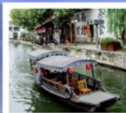
เมืองโบราณหนานสวิน