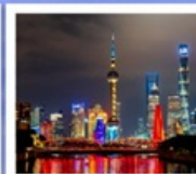
เซี่ยงไฮ้ คลาสสิก ไนท์