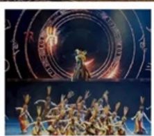
โชว์เว่ยชิว

เชียงใหม่ คลาสสิก ไนต์ (Shanghai Classic Night) หุบเขาเทวดาวังเซียนกู่ (ชมบรรยากาศกลางวันและกลางคืน) หมู่บ้านโบราณหวงหลิ่ง (รวมกระเช้าไปกลับ) สะพานกระจก ถนนโบราณกุนซี / โชว์การแสดงเว่ยชิว / หมู่บ้านโบราณเจียงชาน ถนนหวยไห่ (ร้านกระเป๋าสองมอนต์) / เช็กเมนู 3 ตึกใหญ่แห่งเชียงใหม่ Tian An 1,000 Trees / North Bund Green Land / ถนนอู่กิง