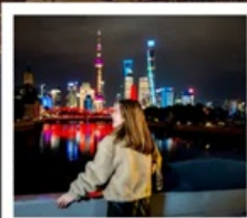
เชียงใหม่คลาสสิกไนท์