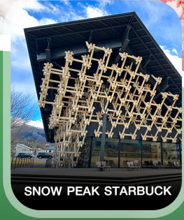
SNOW PEAK STARBUCK

คอนเฟิร์ม ออกเดินทาง ทุกพีเรียด 2 ท่านขึ้นไป