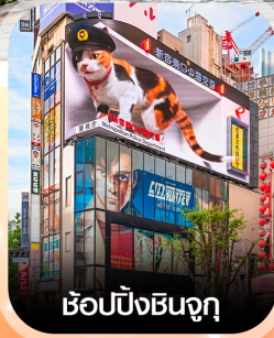
ซ้อปปิงชินจูกุ