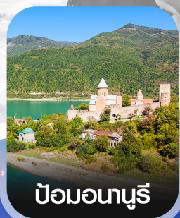
ปอนอนาซูรี