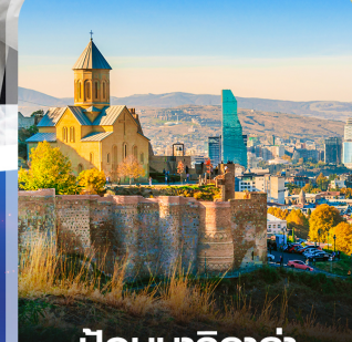
ปอนนารีกาล่า