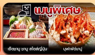
อิชิซาบู ซาบู สลัดสัปปะนุ