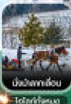
นั่งม้าลากเลื่อน 10:00-12:00

เทศกาลแกะสลักน้ำแข็ง สักใน หมู่บ้านสโนว์ทาวน์ นั่งม้าลากเลื่อน คาเฟ่ชาผสมสบู่ แคมป์รียี่สโนว์โมบิล