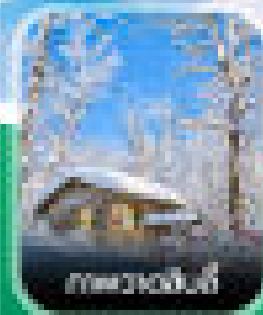
เทศกาลน้ำแข็ง

ฟรีวีซ่าจีน 1 คืน ก่อนขึ้นเครื่องขอวีซ่า ทุกปีเรียก 2 หมื่นบาท