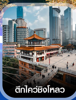
ตึกไค่ว์ซิงโหลว