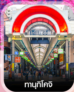
ทามุกิโคจิ

คอนเฟิร์ม ออกเดินทาง ทุกพีเรียด 2 ท่านขึ้นไป