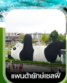
แพนด้ายักษ์เซลฟี่

✈️ คอนเฟิร์ม ออกเดินทาง ทุกพีเรียด 2 ท่านขึ้นไป