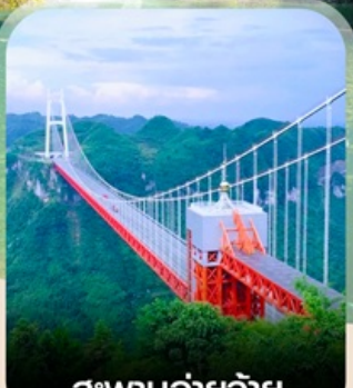
สะพานอ้ายจ้าย