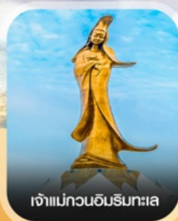
เจ้าแม่กวนอิมริบทะเล

คอนเฟิร์ม ออกเดินทาง ทุกพีเรียด 2 ท่านขึ้นไป