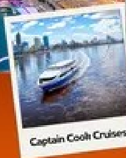
Captain Cook Cruises