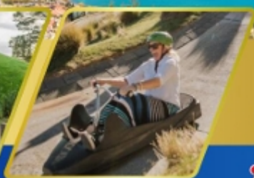
เล่นลู่ที่ควีนส์ทาวน์

AUCKLAND / ROTORUA / CHRISTCHURCH FOX GLACIER / FRANZ JOSEF / QUEENSTOWN