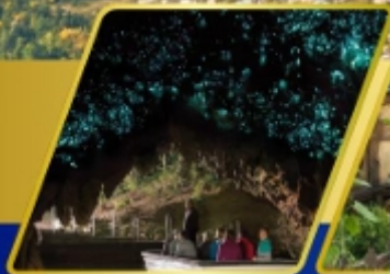
ถ้ำหอบบิต