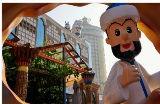
ตลาดนานาชาติซินเจียงแกรนด์บาร์ซาร์