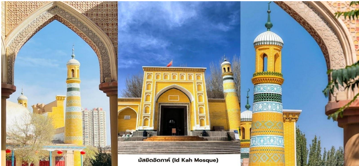
มัสยิดอิตก้าห์ (Id Kah Mosque)

**หมายเหตุสำคัญ** เนื่องจากส่วนหนึ่งของโปรแกรมผ่านเขต Tashkurgan ซึ่งติดชายแดนปากีสถาน และอัฟกานิสถานนักท่องเที่ยวทุกท่านจึงจะต้องมีใบอนุญาตเดินทาง ซึ่งทางทัวร์จะดำเนินการให้