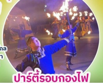
ปาร์ตี้รอกองไฟ