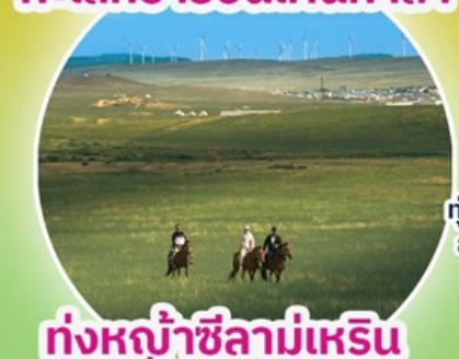
ทุ่งหญ้าซิลามูเหริน