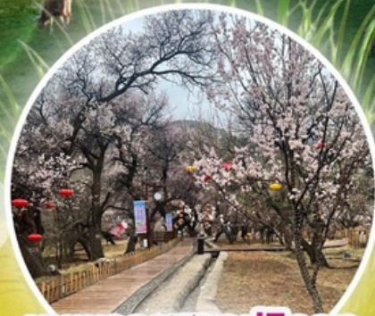
หุบเขาดอกแอปเปิ้ล

ทุ่งหญ้าซิลามูเหริน - พิธีการขอพรจากโอเวบา - ปาร์ตี้กองไฟ - หมู่บ้านชนเผ่ามองโกล สวนวัฒนธรรมมองโกลเหมิงเสียง - หุบเขาดอกแอปเปิ้ล - ทะเลทรายอินเคินทาลา แหล่งวัฒนธรรมมองโกลหยวนหลิว (รวมรถกอล์ฟ 2 ขา) - ตลาดกลางคืนเจียวไถ่ สวนวัฒนธรรมการแต่งงานสุดเอ็กซ์คลูซีฟแห่งเดียวในประเทศจีน บ้านองค์ปฐม - เขตการท่องเที่ยวเจงกิสข่าน-ถนนคนเดินคังปาซ้อ