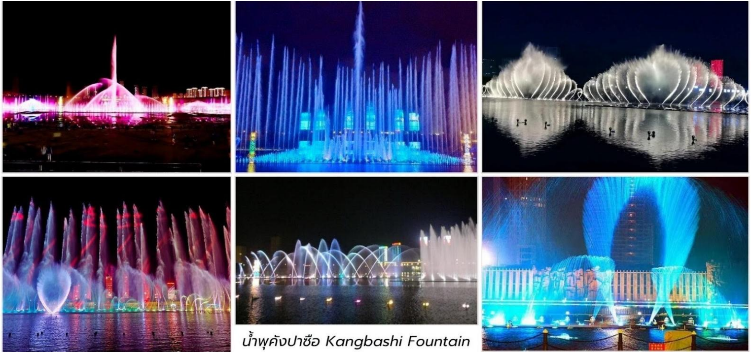
น้ำพุคังปาซื่อ Kangbashi Fountain

ที่พัก Holiday Inn Express Hotel ระดับ 4* หรือเทียบเท่า