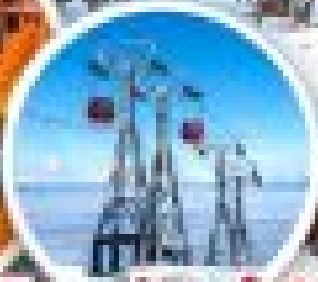
บ้านเรือ