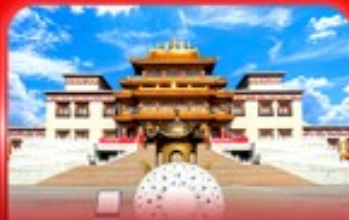
วัดพระโพธิสัตว์จุลาน