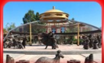
สวนวัฒนธรรมการแต่งจานออร์ดอส