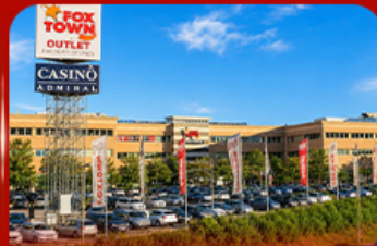
ฟ็อกซ์ทาวน์ ไอทาลีค