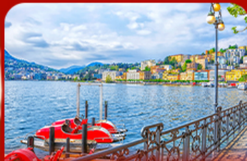
เมืองตากอากาศ ลูการ์โน