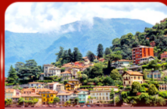
ชนวิวดสวย ทะเลสาบโคโม