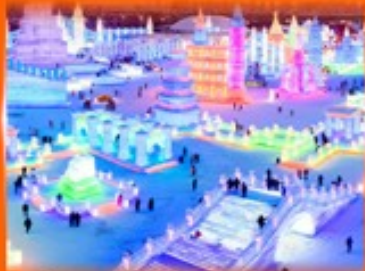
เที่ยว ICE & SNOW WORLD