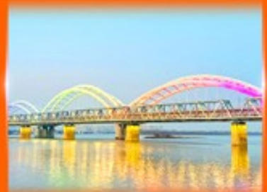
สะพานรถไฟพินโจว