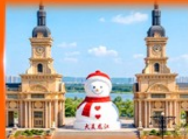
ตึกตาสหิมะยักษ์ ฮาร์บิน