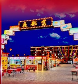
ตลาดกลางคืน ตาลาเดอจี