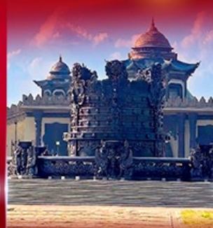
ศูนย์วัฒนธรรม มองโกเลีย หยวนหลิว