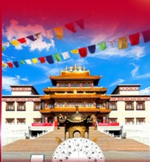
วัดพระโพธิสัตว์ อูลาน