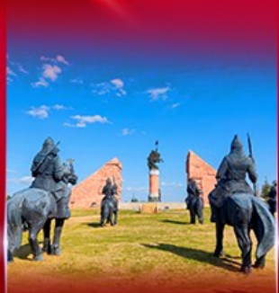
สวนสาธารณะหงกิล่า