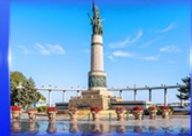
อนุสาวรีย์นิ่ผิง