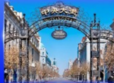
ย่านจงหยาง สตรีท