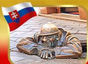
เช็กอินคู่คูมิลเมืองบาติสลาวา