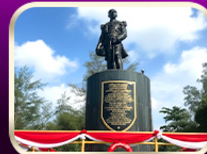
อนุสาวรีย์กรมหลวงชุมพรฯ