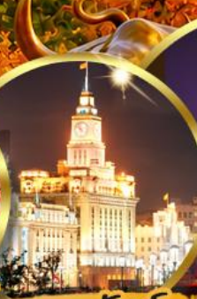
เดอะมันด์