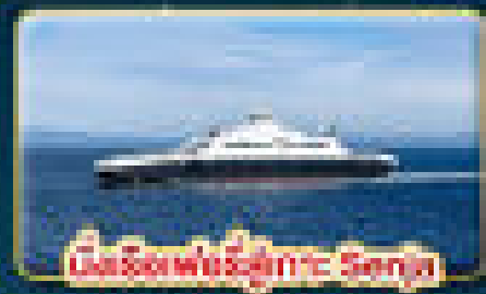
นั่งเรือเฟอร์รี่ข้าม Senja