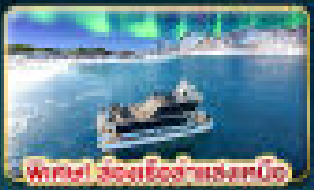
พาชม ล่องเรือชมแสงเหนือ