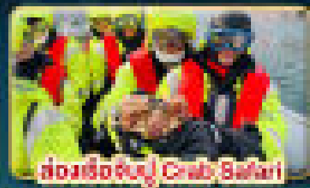
ล่องเรือชมปู Crab Safari

เยือนเมืองหลวงแห่งแสงเหนือ สัมผัสความสวยงามของนอร์เวย์ที่แท้จริง