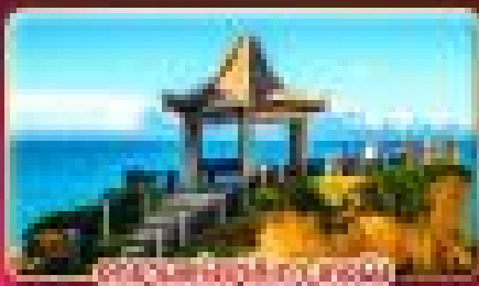
จุดชมวิวเหนือวัดเขาสันติบาล

ชมเทศกาลไฟวิญญู ลานหงส์กลางฟ้าใหม่ 2027 แนะนำแรมส่วนตัวในห้องพัก