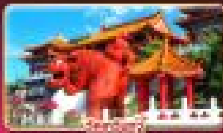
วัดเจียงหนิง