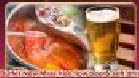
ร้านอาหารจีนรสอร่อยและเครื่องดื่มเย็น ๆ