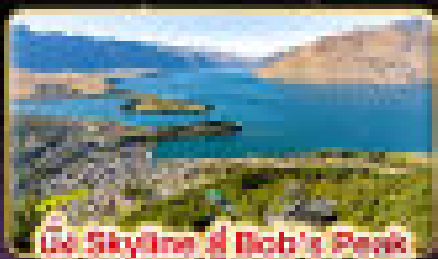
ชม Skyline จาก Bob's Peak