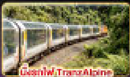
ล่องรถไฟ TransAlpine