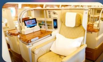
BUSINESS CLASS "บินกลับ"