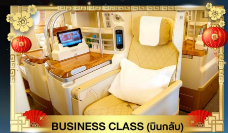
BUSINESS CLASS (บินกลับ)

🧳 น้ำหนักกระเป๋า ขาไป 30Kg. | ขากลับ 40Kg.