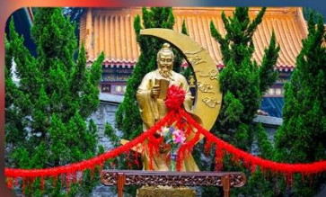
วัดหวังค้ำเซียน