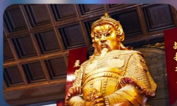
วัดแซงทมิว

THE LUXE MANOR HOTEL หรือเทียบเท่า 4-5 ดาว