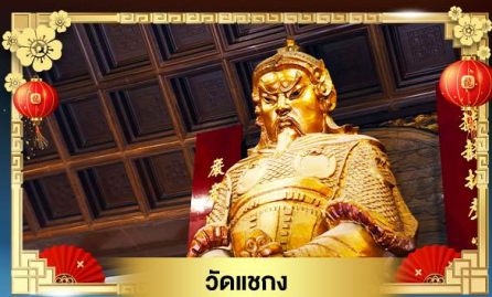
วัดเขากง