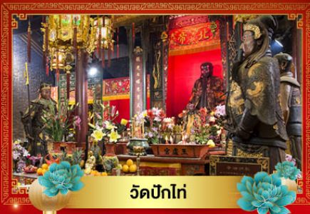
วัดปึกโท่

Miracle of Hong Kong 24,999.- ราคาเพียง เดินทาง : 03-05 มี.ค. 70