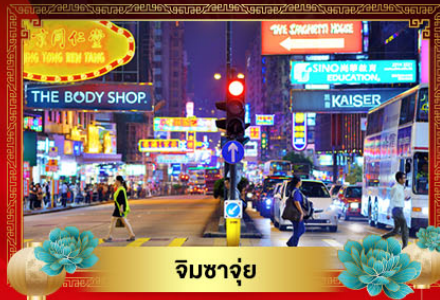
จิมซาจุ่ย